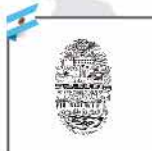
Universidad Nacional de Salta - Argentina