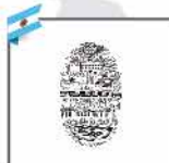
Universidad Nacional de Salta - Argentina