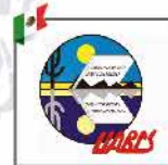
Universidad Autónoma de Baja California Sur - México